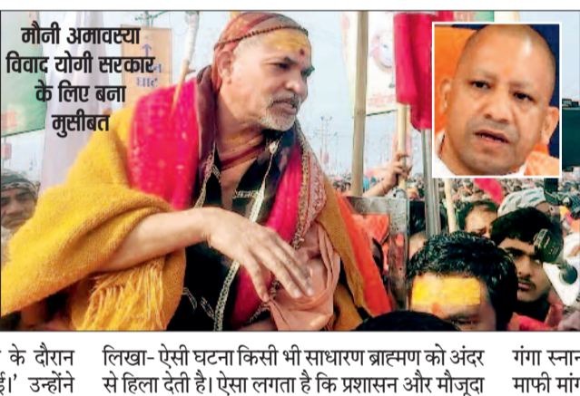
मौनी अमावस्या विवाद योगी सरकार के लिए बना मुसीबत