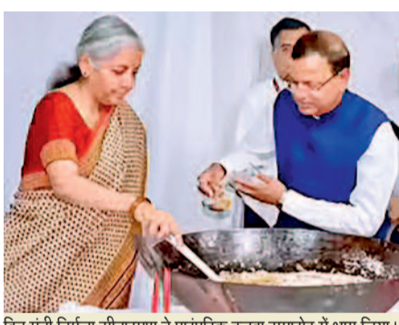
वित्त मंत्री निर्मला सीतारमण ने पारंपरिक हलवा समारोह में भाग लिया।