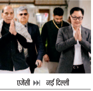
एजेसी ►► नई दिल्ली

बजट सत्र बुधवार से शुरू हो रहा है। इससे पहले मंगलवार को सर्वदलीय बैठक हुई। बैठक में 39 दलों से 51 नेताओं ने हिस्सा लिया। रक्षामंत्री राजनाथ सिंह की अध्यक्षता में ये बैठक हुई। बुधवार को राष्ट्रपति का अभिभाषण और गुरुवार को आर्थिक सर्वे पेश होगा। 1 फरवरी को आम बजट पेश होगा। इधर, सरकार ने बजट सत्र में वीबी जी-राम-जी कानून और एसआईआर पर चर्चा की विपक्ष की मांग को खारिज कर दिया।